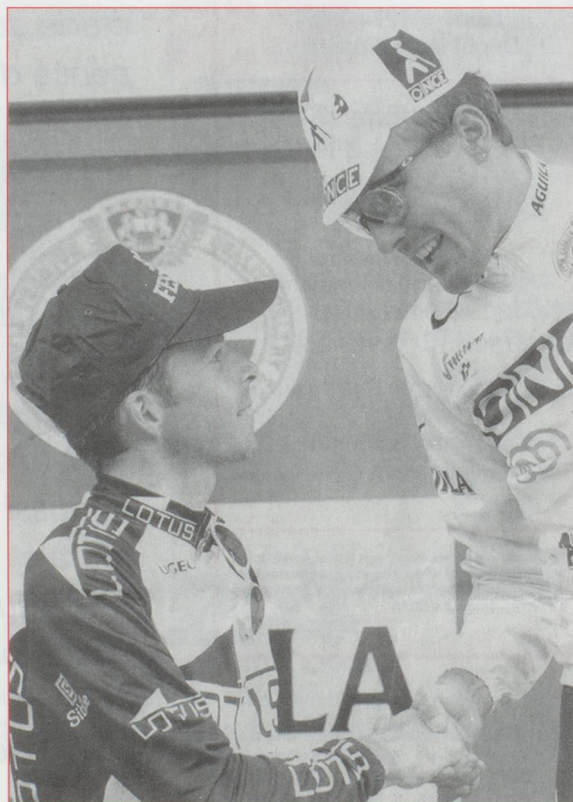
Oubliés les déboires du Tour de France. Le Suisse Alex Zülle (à droite) s'est imposé pour la deuxième année consécutive dans le Tour d'Espagne. Un Tour qui réussit aux Suisses : Tony Rominger l'avait remporté à trois reprises en 1992, 1993 et 1994.

La révision de la loi sur le transport aérien était censée combler le Röstigraben après les choix de Swissair à l'encontre de Cointrin. Elle ne fait en réalité que le mettre en évidence. La nouvelle loi supprime aussi le monopole de Swissair. Cependant, des dispositions transitoires favorables reviennent à préserver son monopole jusqu'en 2008, soit jusqu'à l'expiration de sa concession. Les romands ont obtenu satisfaction sur un point : le plénum a décidé par 84 voix contre 69 que le Département devait tenir compte de la desserte des aéroports nationaux lors de la délivrance de nouvelles concessions aux entreprises suisses.