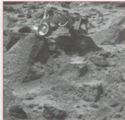
Les chercheurs de l'EPFL ont pensé le pilotage à distance de Sojourner .