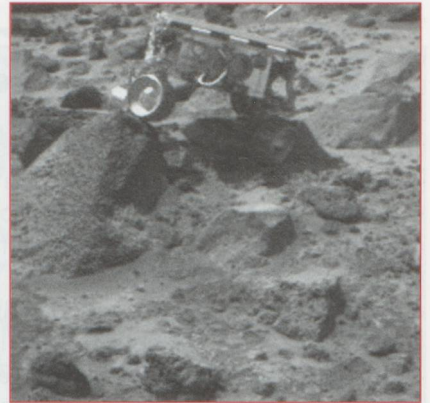
Les chercheurs de l'EPFL ont pensé le pilotage à distance de Sojourner .