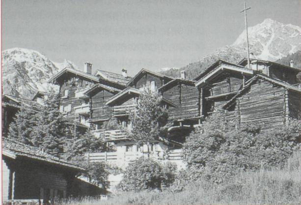
le Val vu de Grimentz

E n Suisse, le Valais présente une entité montagnarde sans égale. Enchassé dans ces massifs d'exception, un joyau de la typicité valaisanne : le Val d'Anniviers. L'histoire du Val dut subir coups et contrecoups des tribulations guerrières, à l'heure des premières émancipations communales. Bien avant les affres de la Révolution française, l'occupation par les troupes du Directoire et la médiation du Premier Consul sur la République Helvétique, le haut Val servit de refuge aux débris décimés d'une incursion sarrasine arrivée par le Grand-Saint-Bernard, et repoussée dans ce cul-de-sac par les indigènes celto-bur-