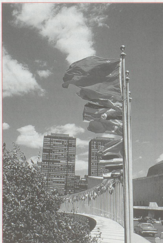
Le débat sur l'adhésion de la Suisse à l'ONU est relancé. Le vote à l'unanimité de l'Assemblée générale d'une résolution sur la neutralité permanente du Turkménistan rend obsolète la principale objection avancée par le peuple et les cantons en 1986. Les socialistes projettent le lancement prochain d'une initiative.

L'industrie militaire suisse est en voie de restructuration : pour pouvoir s'adapter au marché, les quatre entreprises fédérales d'armement devraient être partiellement privatisées et