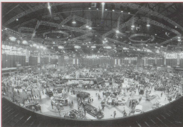
Le dernier Salon de l'auto à Palexpo

NDLR : Au moment où l'avenir de l'AVS facultative des Suisses de l'étranger est débattu, on peut effectivement se poser des questions.