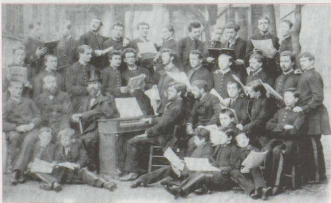
L'École Niedermeyer, vers 1885