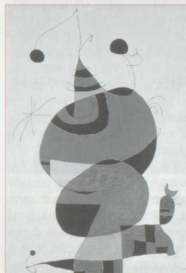
Femme, oiseau et étoile Hommage à Picasso - 1970

La Fondation Pierre Gianadda consacre sa grande exposition d'été au maître catalan. Un par- cours complet en 125 œuvres, dont une rareté de 1925, une toile surréaliste intitulée «Ceci est la couleur de mes rêves», provenant d'une collection privée améri- caine. L'occasion d'admirer l'univers poétique et onirique de Miró sous ses multiples facettes : sans délaisser l'œuvre picturale, l'expo- sition rappelle que Miró fut aussi un sculpteur, un céramiste et l'illustrateur des plus fines plumes de son temps (Desnos, Jarry, Eluard, Leiris, Char ou Prévert).