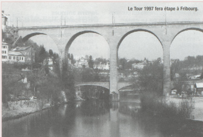
Le Tour 1997 fera étape à Fribourg.