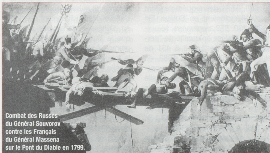
Combat des Russes du Général Souvorov contre les Français du Général Masséna sur le Pont du Diable en 1799.

L'unité de mesure usuelle, le «Saum», équivalait à environ 158 kilogrammes. En général, le transport par le St-Gothard durait «seulement» quatre jours. Le transport de messages joua lui aussi un rôle non négligeable. Qui n'a pas entendu, ou même fredonné, la célèbre chanson : «Je suis du Gothard le dernier postillon» ?