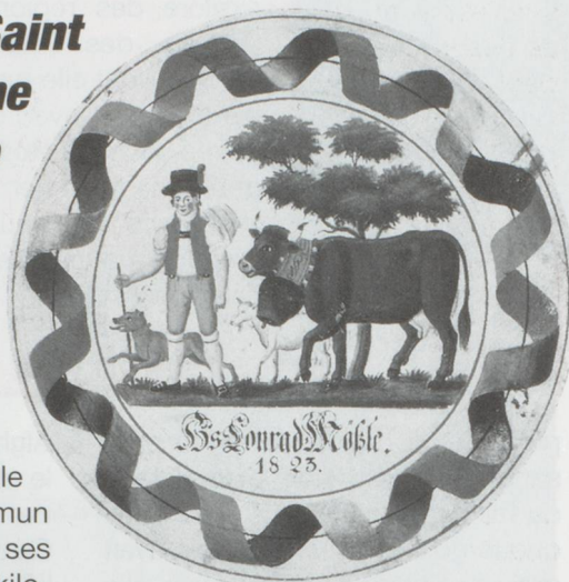
Conrad Starck, Fond de seau à traire, 1823.

au XIX ème siècle, n'étaient pas eux-mêmes des paysans. Autodidactes, ils vivaient de l'artisanat sous toutes ses formes : peinture de mobilier, horlogerie, menuiserie, sellerie. Les thèmes de leurs compositions leur étaient fournis par le rythme invariable des saisons, fait de montées à l'alpage, de foires au bétail, de soirées passées à l'étable, en cabane ou dans des auberges d'altitude. Parmi les artistes exposés, on retrouve, outre Bartholomaüs