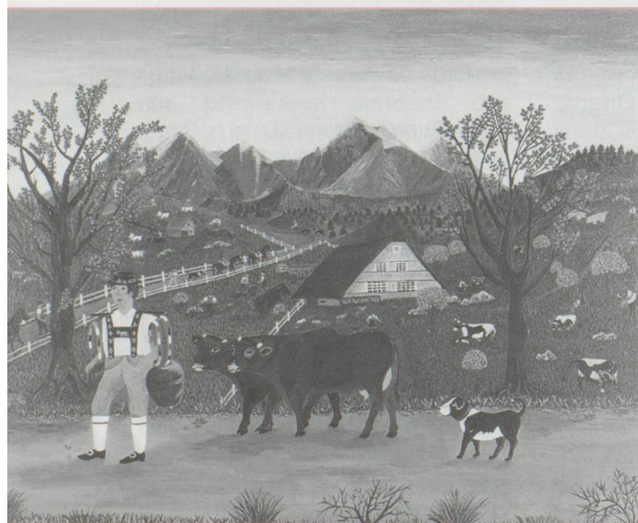
Ursula Stampfli-Howald, Alpenland Tradition.