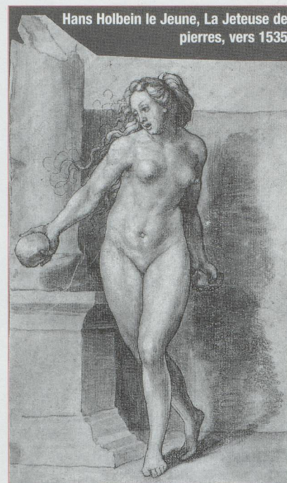
Hans Holbein le Jeune, La Jeteuse de pierres, vers 1535