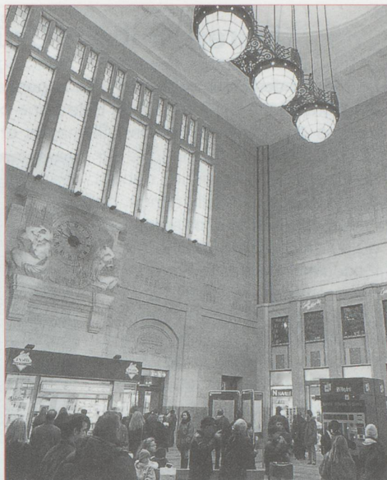
Le hall principal de la nouvelle gare de Lausanne

installés sur l'enseigne de la gare. Elle affiche désormais fièrement : «Lausanne, capitale olympique». Le dépôt des locomotives a quant à lui reçu la visite du train du 150 ème anniversaire des chemins de fer suisses. Enfin, pour les gourmands, un plat de rösti géant de 640 kilos a été cuisiné dans le grand hall : ce nouveau record du monde devrait figurer bientôt dans le Guinness Book.