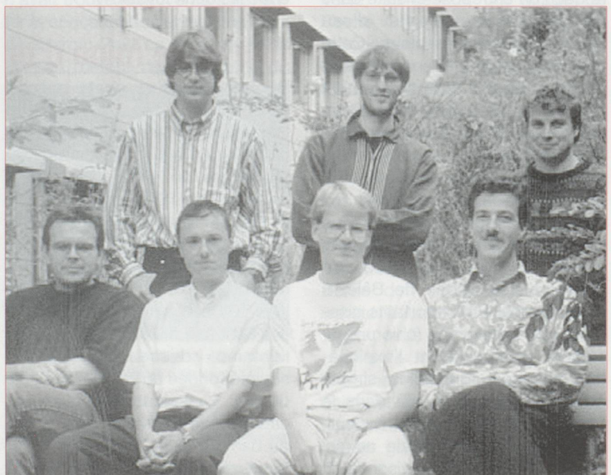
L'équipe de décrypteurs de l'École Polytechnique Zurich.

L'investissement total atteindra quelque 17 millions de francs, financés en grande partie par le Japon. Cent cinquante physiciens pourront enfin tester la pertinence de la théorie générale de l'antimatière, sur laquelle s'appuie la science contemporaine. Pour le Cern, dont le budget a fondu et qui devra sacrifier le plus clair de ses expériences afin de construire le LHC (Large Hadron Collider, son nouvel accélérateur), ce projet est essentiel. Il garantit en effet le maintien d'une importante activité scientifique jusqu'à la mise en service du LHC, à l'horizon 2004.