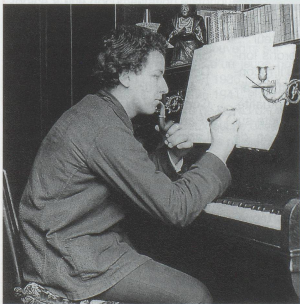
À Paris, hiver 1913-1914.

La France, la Suisse. Toujours sagement, Honegger part faire son École de recrues au moment de la guerre et revient à Paris, rue de Madrid, pour étudier cette fois avec Charles-Marie Widor et Vincent d'Indy. La musique religieuse et le post-wagnérisme. Il se fixe à Paris, fréquente les "montparnos", devient l'ami de Darius Milhaud, écoute Satie, écrit