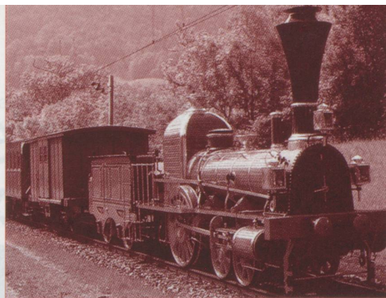
Le « Spanisch-Brötli-Bahn », véritable star des festivités

Aarau se tourne résolument vers l'avenir, illustrant le programme Rail 2000. Ce projet prévoit d'étendre à quatre voies le tracé entre Rapperswil et Olten. Le débit particulièrement intense du trafic sur ce tronçon tient au fait que les liaisons nord-sud et est-ouest empruntent les mêmes voies sur plusieurs kilomètres. On y dénombre en 1995 jusqu'à 400 trains par jour, d'où la nécessité de doubler les voies. Ce sera chose faite dès la fin mai entre Aarau et Rapperswil. De l'autre côté de la gare, direction Olten, deux tunnels urbains à double voie sont déjà prêts. Les changements les plus spectaculaires ont cependant été réalisés dans la gare d'Aarau. Les installations de cette petite gare de province se sont transformées pour faire face à l'augmentation du transit de ce nœud ferroviaire. Prépondérante dans le trafic voyageurs, Aarau occupe également une place de première importance dans l'acheminement des marchandises. Son terminal est l'un des plus grands centres de trans-