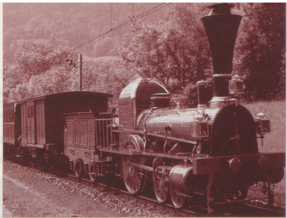
Le « Spanisch-Brötli-Bahn », véritable star des festivités

Aarau se tourne résolument vers l'avenir, illustrant le programme Rail 2000. Ce projet prévoit d'étendre à quatre voies le tracé entre Rapperswil et Olten. Le débit particulièrement intense du trafic sur ce tronçon tient au fait que les liaisons nord-sud et est-ouest empruntent les mêmes voies sur plusieurs kilomètres. On y dénombre en 1995 jusqu'à 400 trains par jour, d'où la nécessité de doubler les voies. Ce sera chose faite dès la fin mai entre Aarau et Rapperswil. De l'autre côté de la gare, direction Olten, deux tunnels urbains à double voie sont déjà prêts. Les changements les plus spectaculaires ont cependant été réalisés dans la gare d'Aarau. Les installations de cette petite gare de province se sont transformées pour faire face à l'augmentation du transit de ce nœud ferroviaire. Prépondérante dans le trafic voyageurs, Aarau occupe également une place de première importance dans l'acheminement des marchandises. Son terminal est l'un des plus grands centres de trans-