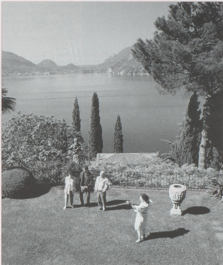
Le parc du château de Morcote.

Silvio Corsini, conservateur de la Réserve précieuse, c'est-à-dire des livres rares que possède la BCU, s'est rendu à Madrid pour trier la collection du marquis de Balbuena. Sur les quelque 5 000 ouvrages légués, il en a retenu 300, parmi lesquels un armorial du siècle dernier peint à la main, et des livres des XVII e et XVIII e siècles traitant de l'histoire ou des blasons des familles princières d'Europe et des Grands d'Espagne. Une fois arrivés à Lausanne, ces livres seront exposés à la Bibliothèque de Dornigney. Les livres rares rejoindront ensuite la Réserve précieuse, un local climatisé où règnent les conditions idéales de chaleur,