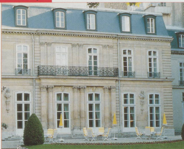
Façade, côté jardin, de l'Hôtel de Chanac de Pompadour, siège de l'Ambassade de Suisse en France.

Se succèdent, pendant quatre jours, des réceptions : Philippe d'Orléans, Turenne, Condé, Aumont, Villeroy, Colbert, Le Tellier se disputent les hommes en noir. Mais aussi se déroulent des négociations sur les points dits de détail du Traité. Une notable partie des acquis dus à François 1 er et Henri IV sont sauvés. Les soldats protestants pourront continuer d'exercer leur culte de même que