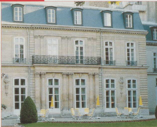
Façade, côté jardin, de l'Hôtel de Chanac de Pompadour, siège de l'Ambassade de Suisse en France.

Se succèdent, pendant quatre jours, des réceptions : Philippe d'Orléans, Turenne, Condé, Aumont, Villeroy, Colbert, Le Tellier se disputent les hommes en noir. Mais aussi se déroulent des négociations sur les points dits de détail du Traité. Une notable partie des acquis dus à François 1 er et Henri IV sont sauvés. Les soldats protestants pourront continuer d'exercer leur culte de même que