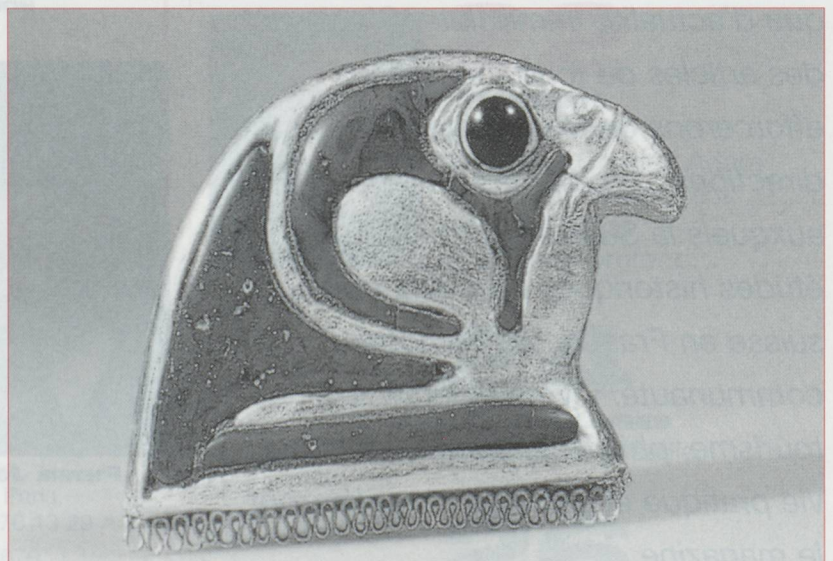
Tête de faucon en or. Incrustations polychromes en pâte de verre. Élément d'un pectoral. Collection Schindellegi

St Alban-Graben 5, Bâle • Jusqu'au 13 juillet, du mardi au dimanche de 10h à 17h, nocturne le mercredi jusqu'à 21h.