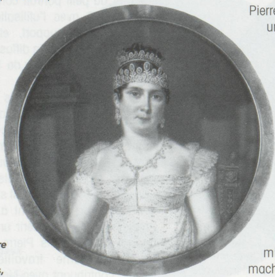
Portrait sur ivoire de Joséphine de Beauharnais, par Pierre Louis Bouvier

boucle d'oreilles et double diadème de turquoise et de diamants, révèle la minutie du peintre sur émail que fut aussi l'artiste genevois. Bien que les deux techniques diffèrent, il arrivait parfois que des artistes soient à la fois miniaturiste et peintre sur émail. C'est ce qui explique la présence des miniatures au Musée de l'horlogerie de Genève, qui est aussi le Musée de l'émaillerie. Les émaux peints ont été très utilisés pour décorer les montres, tabatières, ou portés en bijoux.