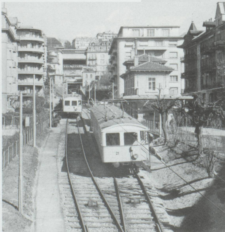
Le funiculaire Lausanne-Ouchy

Une chose est sûre, en tout cas, la population genevoise sera plus nombreuse en 2020 qu'aujourd'hui. Mais ce ne sera pas le fait des familles nombreuses. Avec 1,5 enfant par couple en l'an 2000 (1,54 pour les étrangers), le renouvellement des générations n'est même pas assuré ! Alors, outre l'arrivée de migrants, c'est la longévité, toujours plus importante, qui contribuera à l'accroissement de la population. Les femmes vivront jusqu'à 85 ans, quand les hommes se limiteront à 78 ans, en moyenne. Tout cela aura pour conséquence le vieillissement des Genevois, et la diminution