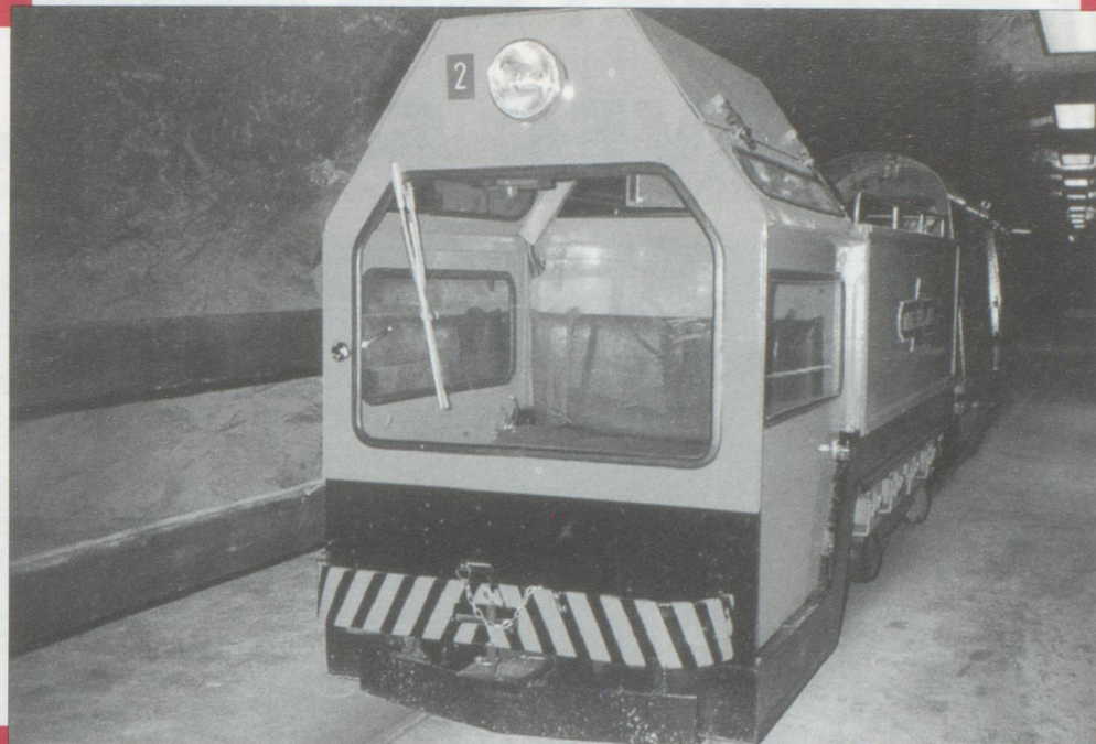
La cabine des locotracteurs est surbaissée afin de s'inscrire dans le gabarit étroit des galeries