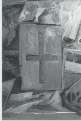
Deux des toiles qui constituent le patchwork réalisé par Rouyer et Constantin Hagondokoff.

LA NOUVELLE ECOLE DE MONT-PARNASSE organise une exposition, du 8 au 30 juin, à l'Espace d'Art Contemporain. A cette occasion, les peintres Rouyer et Constantin Hagondokoff ont créé un concept mural, composé de 18 toiles, et intitulé "Suite et progression écossaise". L'ensemble occupera un espace de 4,80 m sur 3. Après s'être entendus sur le sens général de l'oeuvre, les deux artistes ont travaillé séparément, s'entretenant régulièrement de l'avancée de leurs toiles. Chacun dans son atelier, à l'écoute de l'œil de l'autre, a su répondre à la dynamique enclenchée, et la relancer. A