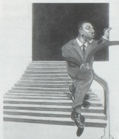
Francis Bacon est exposé au Musée des Beaux-Arts de Lausanne

Antonio Girbes, photographies. Jusqu'au 30 janvier, du mardi au vendredi de 15h à 19h, le samedi de 10h à 12h et de 15h à 19h.