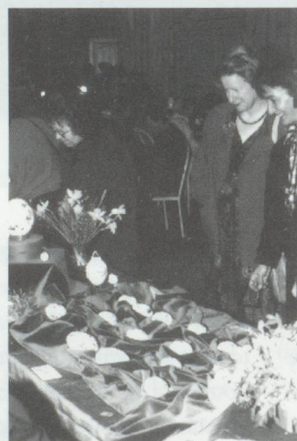
Vente d'œufs de Pâques au Casino de Berne.

Pour bien préparer les fêtes de Pâques, les visiteurs ont également trouvé des œufs frais, et de quoi les décorer eux-mêmes s'ils se sentaient en veine créatrice ; des bouquets de fleurs, des pâtisseries pascales étaient aussi proposées. Un confiseur moulaït sur place des lapins en chocolat, prêts à remplir leur mission annuelle: emporter les œufs de Pâques pour les dissimuler dans les jardins.