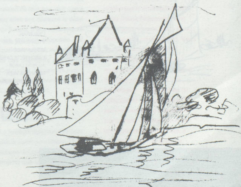
L'EVA, JAUGE MOYENNE, AU PLUS PRÈS AVANT LE CHÂTEAU D'YVOIRE.

La jauge internationale (J.I.) apparut vers les années 1910. L'architecte naval jouait toujours un rôle certain, mais les bateaux, ainsi normalisés, perdaient