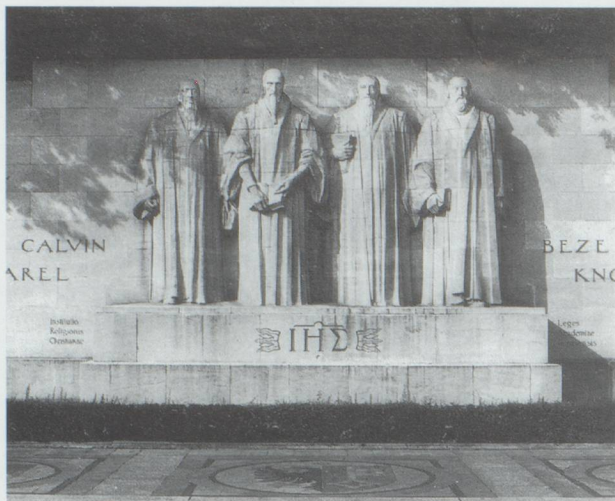
MUR DES RÉFORMATEURS