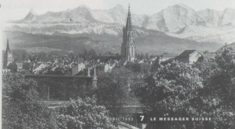
La Cathédrale de Berne (le "Münster") avec, en arrière plan, les Alpes.

Abaissier la pâte, en garnir une plaque graissée et y répartir les oignons. Laisser refroidir. Entre-temps, mélanger les oeufs, la farine, le lait, le sel, le cumin et la muscade et verser sur la tarte aux oignons. Cuire environ 45 minutes au four à 220 degrés.