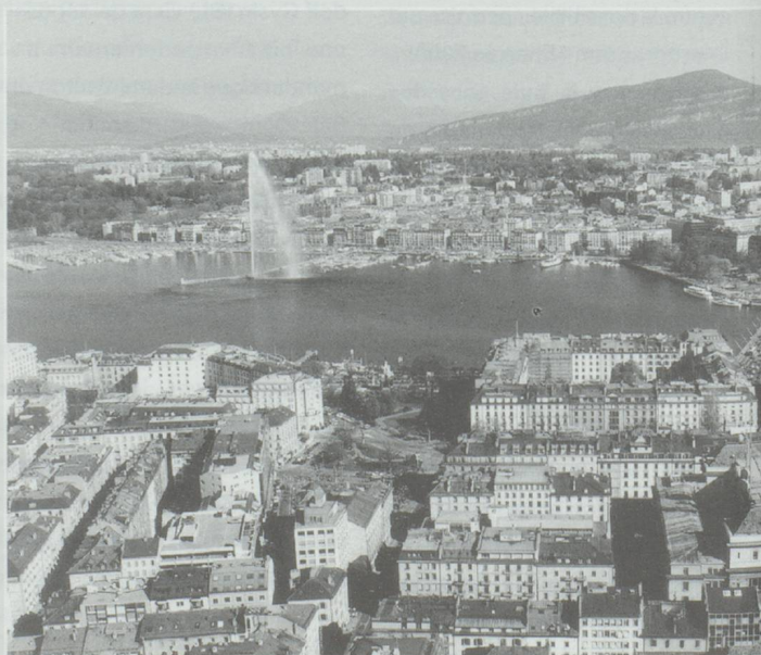
Genève. La ville a décidé de se donner une nouvelle chance pour relancer le tourisme.