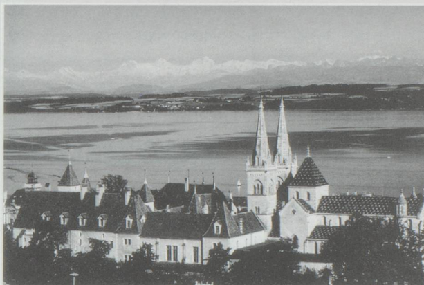
Neuchâtel : le Conseil d'Etat vient de proposer au Grand Conseil un projet de réorganisation complet de l'appareil administratif.

Définie il y a de cela un peu plus d'un siècle, la structure du gouvernement neuchâtelois commençait à prendre quelques rides. Soucieux d'une meilleure adaptation aux besoins d'aujourd'hui et d'une plus grande efficacité, le Conseil d'Etat vient de proposer au Grand Conseil un projet de réorganisation complet de l'appareil administratif. De dix départements (agriculture, police, cultes, instruction publique, justice, finances, économie, intérieur, travaux publics et militaire), on passerait à cinq. Le but étant de rationaliser et d'éviter que les secteurs importants (principalement les affaires sociales, la santé et l'environnement) ne dépendent de plusieurs départements sans que l'on sache forcément à qui sont dévolues les compétences.