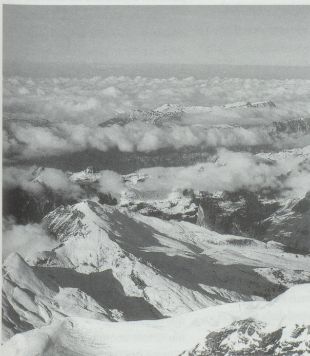
La F/A-18 a du succès dans plusieurs pays. Mais volera-t-il un jour dans le ciel suisse ?

Avec les 68 F/A-18 déjà commandés par la Finlande, de nouvelles commandes du même appareil par d'autres pays ne peuvent que faire baisser les coûts de l'unité. Encore faut-il, pour que l'armée suisse en profite, que le peuple helvétique vote cette année (probablement au mois de juin) en faveur de cette dépense d'armement de 3,5 milliards de francs suisses. ■