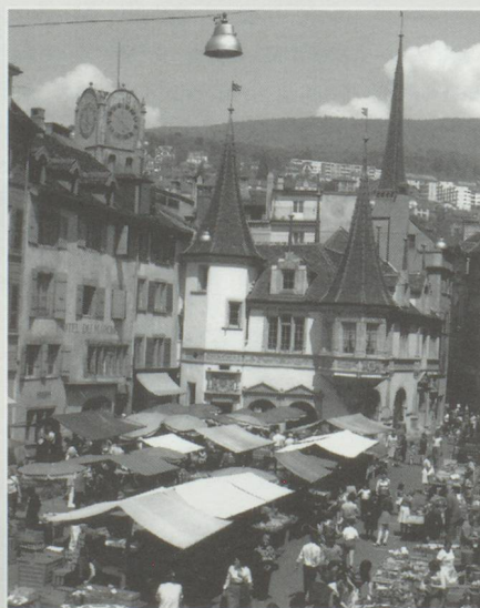
Un prix pour faire connaître Neuchâtel.

Les comptes 1991 de l'Etat de Vaud se soldent par un déficit de quelque 155 millions de frs.s. Alors que les recettes atteignent 3,719 milliards de frs., les dépenses s'élevaient à 3,874 milliards. Par rapport aux comptes 1990, les recettes ont augmenté de 225 millions de frs., tandis que l'on enregistrait une hausse des dépenses de 336 millions. En ce qui concerne les recettes fiscales, la