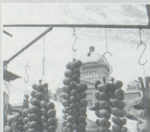
Le "Zwibelemärit" : une tradition bernoise.

Pour les 800 ans de Berne : le "Zwibelemärit" en photos et l'"Histoire de Berne" en BD