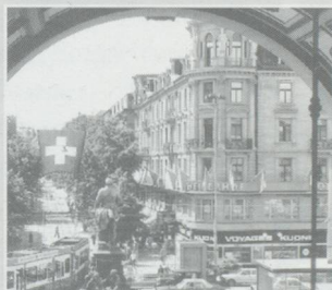
La place de finances s'enrichit d'un nouveau scandale ...