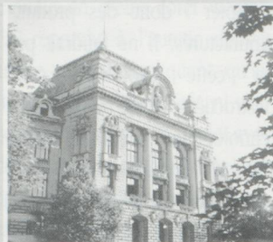
L'Université de Berne. Des cours seront suspendus pour des raisons économiques.

Les cours de sociologie du développement, donnés par le Conseiller National socialiste Jean Ziegler, chargé de cours depuis 1968 à l'Université de Berne, sont menacés par les économies imposées à la haute école. La Faculté de Droit et de Sciences Economiques a en effet décidé de suspendre en premier lieu les postes des chargés de cours.