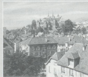
A Neuchâtel, on se demande qui est pauvre dans le canton ...