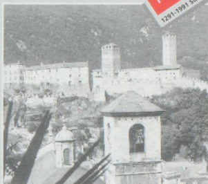
"Castelgrande" à Bellinzona. L'ouverture du 700ème y a eu lieu.