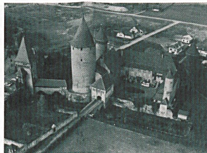
Cité historique. Estavayer-le-Lac avec son Château.