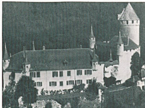
Le Château de Lucens qui est restauré et conservé par la Galerie Koller de Zürich.

Pour avoir les pieds dans l'eau : Estavayer-le-lac. Côté cour, une enceinte de murailles et de tours, une mosaïque de monuments anciens aussi divers que séduisants : château, collégiale, musée et monastère témoignent d'un passé artis-