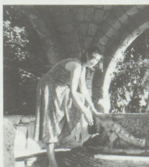
Suisse à 42°C. Il fait bon se rafraîchir les pieds à une fontaine séculaire.