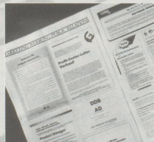
Un marché de l'emploi complètement sec : les journaux regorgent d'offres d'emplois.

■ Le Conseil Fédéral propose d'augmenter d'environ 8000 personnes les contingents de travailleurs étrangers en Suisse pour la période 90/91, dont 7000 pour les autorisations saisonnières. En outre, 2000 unités seront transférées de la compétence fédérale à celle des cantons.