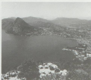
Ci-dessus : Lugano et son sommet bien connu, le San Salvatore.