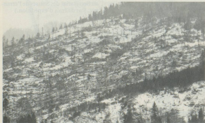
Dégâts dus à la tempête dans le canton de Glaris: des forêts de protection entières ont été dévastées.