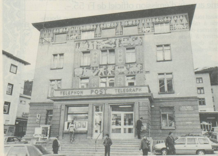
L'ancien Musée Kirchner à Davos.

une communauté d'intérêts qui s'est fixé pour but de n'offrir que des moyens de transport respectueux de l'environnement. Dans ces stations, il est notamment interdit de circuler avec des véhicules ayant un moteur à explosion; des dérogations ne sont accordées qu'à titre tout à fait exceptionnel.