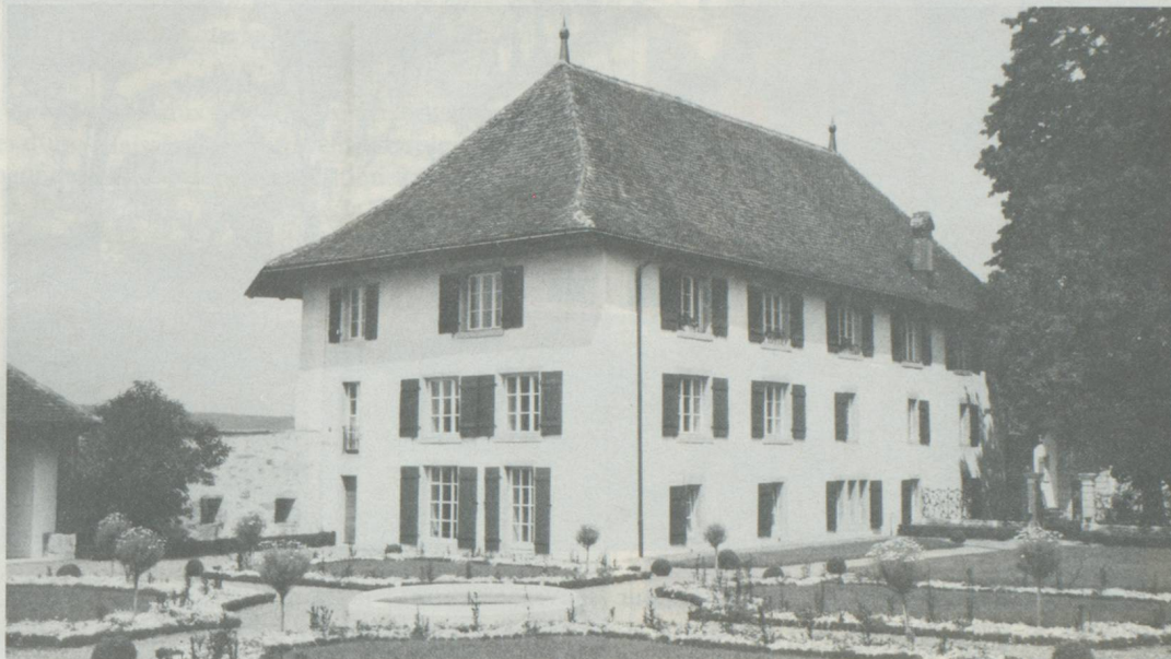
Une réalisation de la NSH: le Stapferhaus, au château de Lenzbourg.