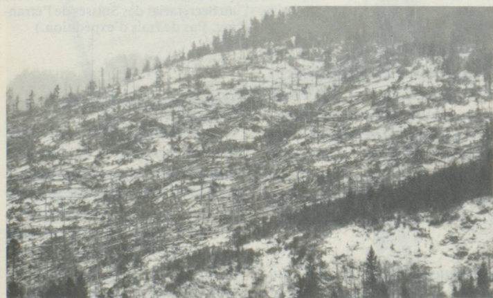
Dégâts dus à la tempête dans le canton de Glaris: des forêts de protection entières ont été dévastées.