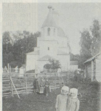
Les enfants du fromager suisse et propriétaire de domaine Emil Rieder devant l'église de Maloe Vosno (Russie) vers 1910.

D'autre part, l'histoire de l'émigration vers la Russie montre qu'il n'y avait pas seulement des gens pauvres et des aventuriers qui émigraient: les trois quarts des passeports établis dans le