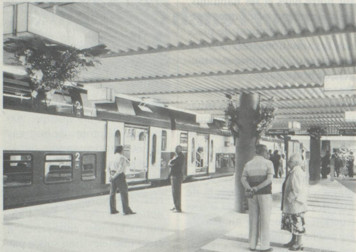
Signe distinctif du train express régional zurichois: les trains navettes modernes à deux étages, ici dans la nouvelle gare «Museumsstrasse».

Un nouveau chapitre dans l'histoire des transports suburbains s'ouvrira à la fin mai de cette année: le train express régional zurichois, qui est le système de transport de l'avenir, sera mis en service. La communauté tarifaire zurichoise, dont font partie les 34 entreprises de transports publics du canton, entrera en vigueur en même temps que sera inauguré le système de train express régional, d'une longueur de 380 kilomètres, qui emprunte en grande partie le réseau des Chemins de fer fédéraux déjà existant. Ce réseau, qui a subi une extension massive par la construction de nouveaux tronçons, de nouveaux tunnels et de nouvelles gares, par l'ac-