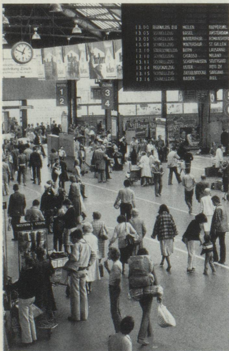
L'exactitude des trains suisses: un phénomène étonnant pour beaucoup d'étrangers.

A ce sujet, il semble que l'argent est aussi abondant en Suisse que le sable au bord de la mer. Personne ne sait exactement combien il y en a. Il est vrai que les Suisses ont de l'argent, mais ils ne le montrent pas. La majorité des gens croit naïvement – et je dirai qu'en cela aussi, la clairvoyance n'est pas supérieure à la moyenne – que la stabilité et la prospérité que connaît actuellement la Suisse sont le fruit du travail acharné de la population. Cette majorité ne pense pas un seul instant à l'afflux en Suisse de milliards de