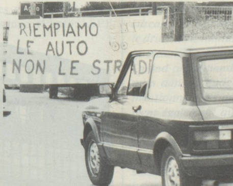
Protestation contre les pendulaires venant en voiture, dans le Malcantone: «Remplissons les voitures et non les routes.»

Ces chiffres montrent la profonde évolution de l'organisation territoriale cantonale. Le Tessin, une des régions les plus montagneuses de Suisse, est aujourd'hui parmi les plus urbanisées – le 76% de la population réside dans les quatre agglomérations de Lugano,