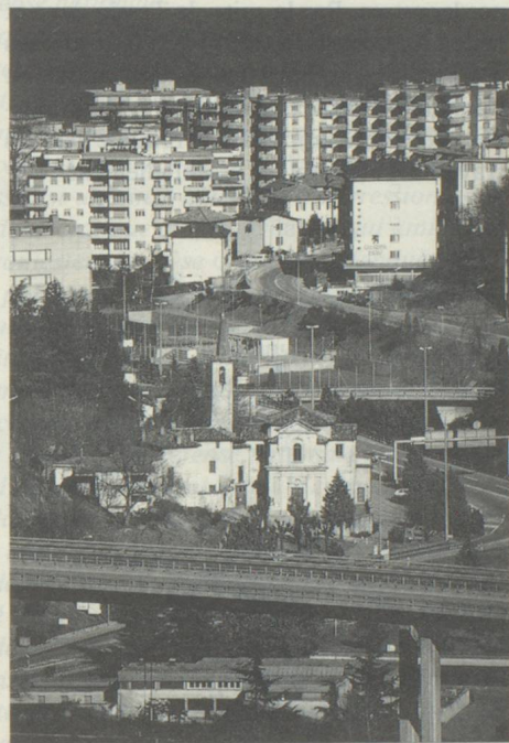
L'urbanisation du Tessin: le 76 pour cent de la population vit dans des agglomérations (Lugano; photo: Giosanna Crivelli).

L'image traditionnelle, qui évoque la petite dimension d'un canton montagnard, séparé par les Alpes et possédant une frontière au sud, justifia «le développement raté et précaire du Tessin, parce que bloqué par des in-