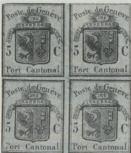
GENÈVE — « Port Cantonal » Émis en 1845 - Bloc de 4