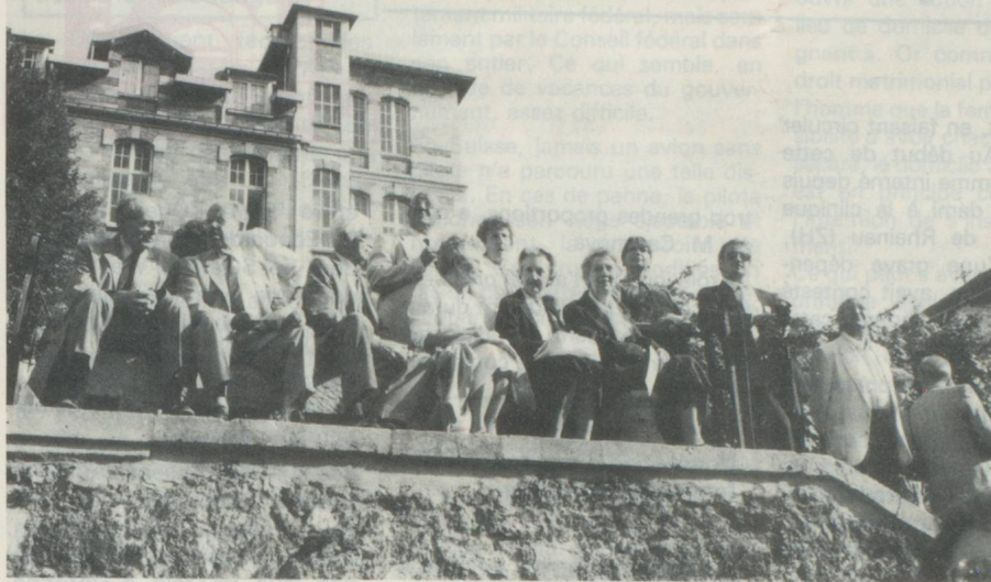
De nombreux amis étaient venus participer à cette fête !

cet instant particulier pour retracer succinctement l'histoire du Pacte Fédéral des Confédérés.