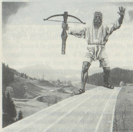
Guillaume Tell menant un combat politique («Halte au béton»)...

Uli Windisch et Florence Cornu. Tell au quotidien. Edition M. Zurich 1988. Fr.s. 58.- (vous pouvez commander ce livre au Secrétariat des Suisses de l'étranger). Existe aussi en allemand sous le titre «Tell im Alltag»