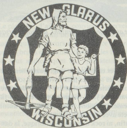
...faisant le tour du monde (colonie suisse de New Glarus aux Etats-Unis)...