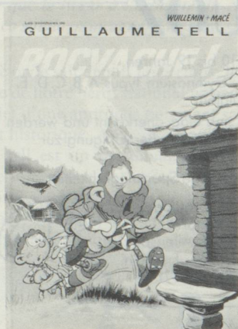
René Wüillemin, Gilbert Macé. Les aventures de Guillaume Tell (aujourd'hui, 5 volumes sont parus). Editions des 3 Pommes. Case postale 127, 1211 Genève 4.

complet. Guillaume est un Helvète moyen, avec ses coups de cœur, ses rognés, ses soucis, ses agacements, ses colères, ses contrariétés, ses coups de gueules, ses scènes de ménage, ses impôts, ses amis et ses ennemis.