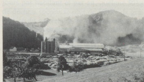
Fabrique de bois aggloméré dans la campagne lucernoise: faire respecter les prescriptions pour la pureté de l'air n'est pas chose aisée.

● Les émissions d'oxydes d'azote ( \text{NO}_x ) que l'on trouve dans l'atmosphère sous la forme de dioxyde d'azote, sont aujourd'hui trois fois plus élevées qu'en 1960. En Suisse, les trois quarts environ des émissions de \text{NO}_x proviennent du trafic routier motorisé, donc de la combustion de carburant. Bien que les normes relatives aux gaz d'échappement rendent le catalyseur obligatoire à partir de 1987 pour les voitures neuves, ce qui a pour effet de réduire progressivement les émissions de \text{NO}_x , il y aura encore, en 1995, deux fois plus d'oxydes d'azote qui s'échapperont dans notre atmosphère qu'en 1960.