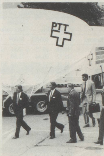
«L'oreille» du monde: le conseiller fédéral Ogi (au milieu) devant la station mobile de réception de satellites à Naefels.