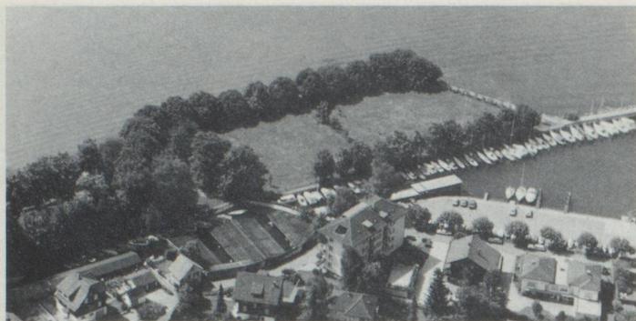
Place des Suisses de l'étranger