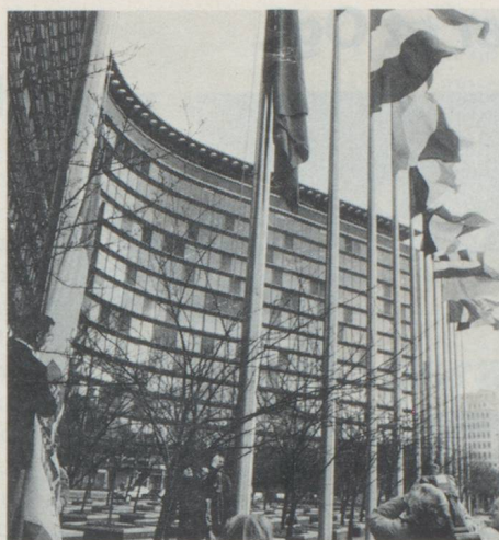
... mais n'entrera sans doute jamais dans le bâtiment de la CE à Bruxelles.

«politique active d'intégration», qui éviterait par la suite des discriminations.