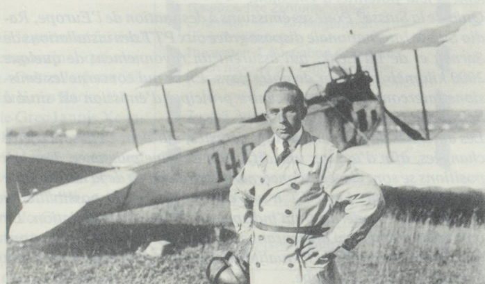
Walter Mittelholzer, pilote militaire...

Werner Mittelholzer naquit le 2 avril 1894, à St-Gall. Fils d'un maître-boulangier, il se passionna dès son plus jeune âge pour la montagne et la photographie.