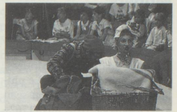
Le cirque d'enfants Basilisk (photo: J.-Ph. Daulte).

D'innombrables spectacles, expositions, conférences et films feront de Lausanne la capitale du cirque jusqu'à la mi-octobre. Quelque 400 artistes s'y sont donnés rendez-vous cet été. Parmi eux, le clown et jongleur Carello, les maîtres de l'illusion Fantasio et Mr. Steve, le clown Marco Morelli, le contorsionniste Rocky Rendal, les chiens acrobates et le «Theatro Ingenuo», Crouton, le spectacle de rue de Karl Kuene, le dompteur de panthères Hans Bleiker, les magiciens chinois Chun Chin