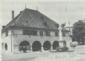
Hôtel des six communes, Môtiers.

Le produit de la collecte 1987 en faveur de la protection du patrimoine servira à restaurer une trentaine de maisons à Môtiers, dans le Val-de-Travers. Le philosophe Jean-Jacques Rousseau a vécu plus de trois ans (1762-1765) dans ce petit village du Jura neuchâtelois, qui aujourd'hui encore semble sorti d'un livre d'images.