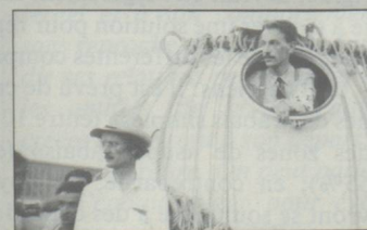
Auguste Piccard (à gauche) en 1932.

■ Il y a 25 ans décédait le professeur Auguste Piccard , un des plus grands et plus courageux chercheurs que la Suisse ait connus. Au début des années trente, ce scientifique aux talents multiples s'est envolé à une altitude jamais atteinte jusqu'alors à bord de son ballon stratosphérique.