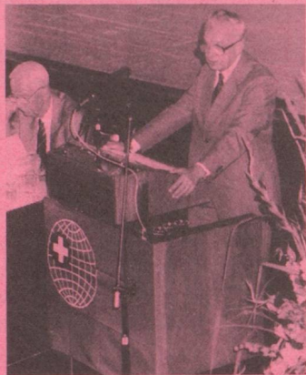
Le conseiller fédéral Léon Schlumpf, qui se retire à la fin de cette année, s'adresse aux Suisses de l'étranger.

Un autre point fort de l'assemblée plénière a été, pour tous les participants, le discours plein d'esprit et d'idées du conseiller fédéral Léon Schlumpf, qui se retire à la fin de l'année: il a souhaité une cordiale bienvenue aux personnes présentes, dans les quatre langues nationales.